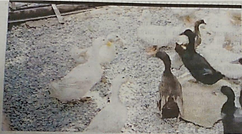
ITIK yang diternak seorang lelaki di hadapan rumahnya di Permatang Badak di Kuantan.