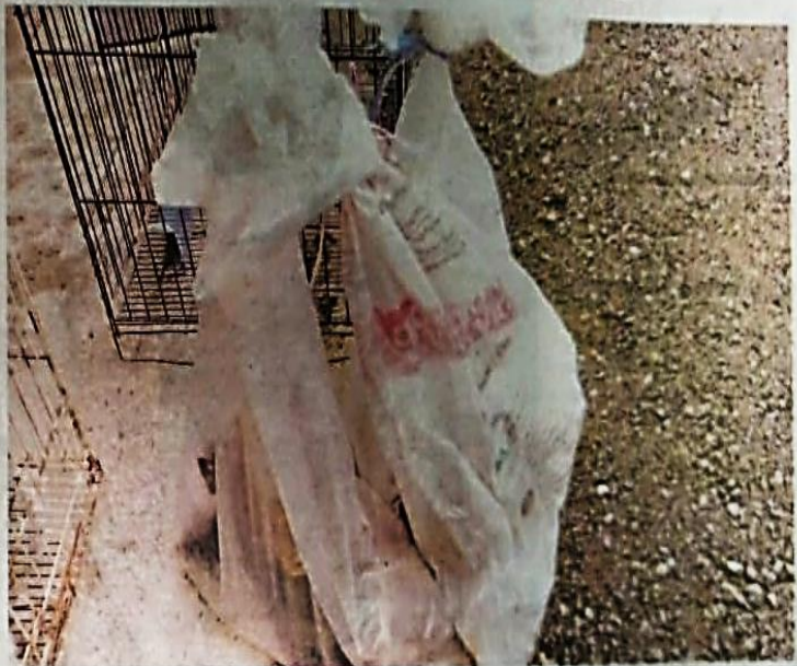
BEBERAPA ekor kucing jalanan yang dimasukkan ke dalam guni sebelum dihantar ke Bustana Kucing di Kangar. Perlis baru-baru ini.

Premis tersebut turut memiliki fasiliti perubatan yang digunakan untuk merawat kucing yang mem-